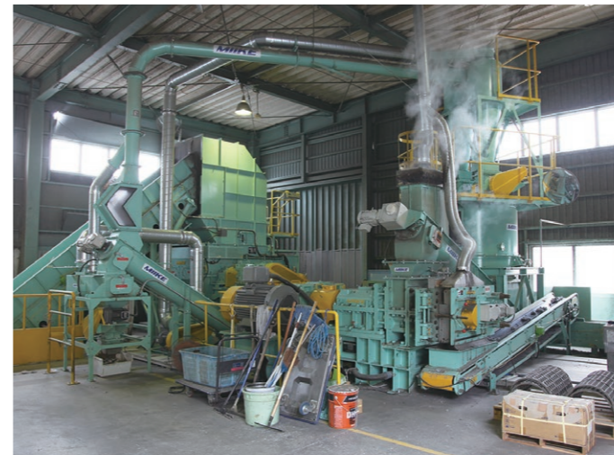
固形燃料(RPF)製造プラント

主に産業廃棄物のうち、マテリアルリサイクルが困難な紙類やプラスチック類を原料として、固形燃料を製造するプラントです。混合廃棄物機械選別設備をはじめ、各種の事業所、工場および一般廃棄物から選別された原料を圧縮加工して燃料化します。石油系の燃料の代替として利用され、燃料費とCO2の削減に貢献しています。