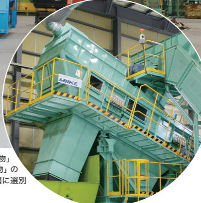
バリオセパレーター