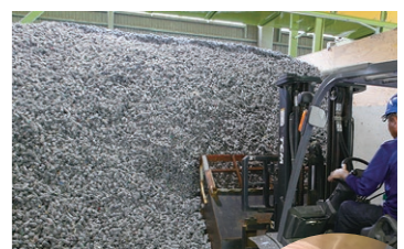
衣類(繊維類など)の選別・保管