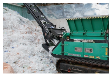
材料のビニール、プラスチック類の選別・保管